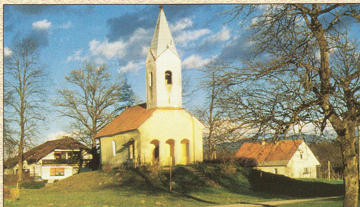
Čadraze - p.c. sv. Urha stoji na veliki prazgodovinski gomili

Ti mogočni spomeniki v meglo zavrtih stoletij sredine 1. tisočletja pred našim štetjem nemo pričajo o moči in vplivu rodov, ki so poseljevali območja med Savo in Kolpo, vzhodno od Ljubljane. Ti »barbarski« sodobniki antičnih Grkov in Etruščanov niso bili le nemočni opazovalci začetkov ustvarjanja visoke zahodnoevropske civilizacije, temveč so bili tudi njeni soustvarjalci. Njihovega imena ne poznamo, njihov način življenja, verovanja, ekonomije in materialni svet pa jih najbolj povezuje z Iliri, živečimi na Balkanu.