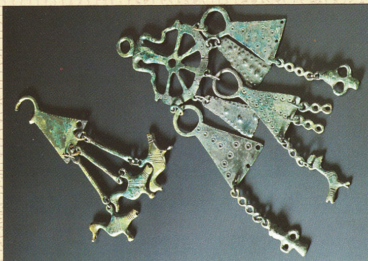
Vinkov Vrh - antropomorfen obesek s priveski

Od vseh arheoloških obdobij je prav starejša železna doba pustila navzven najbolj vidne sledove. Utrjena železnodobna gradišča, ki so obvladovala razgledne vrhove dolenskega gričevja, so se s svojimi obzidji ohranila do današnjih dni. Velike, v tlorisu zemljene gomile - zadnja počivališča železnodobnih knezov, železarjev, steklarjev, kovačev, lončarjev, trgovcev, vojakov in kmetov, se še vedno dvigujejo po pogozdenih pobočjih pod gradišči.