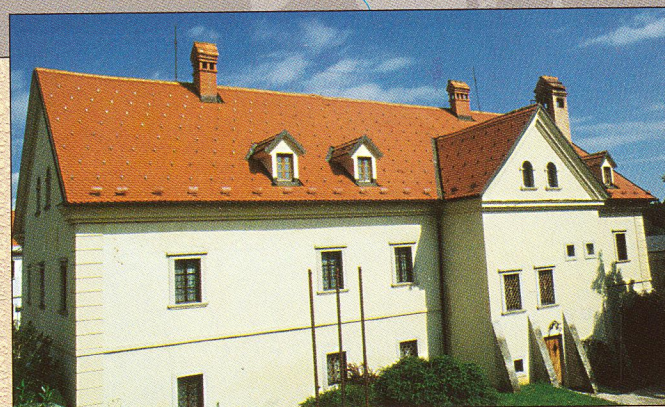
Novo mesto - Dolenjski muzej, stavba nekdanjega nemskega križarskega reda - Križatija, v kateri se nahaja arheološka zbirka