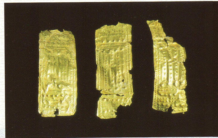
Novo mesto - Kapitelska njiva, deli zlatega diadema (5.-4. stoletje p.n.š.). V bogatih (knežjih) grobovih se pojavljajo tudi predmeti iz plemenitih kovin.