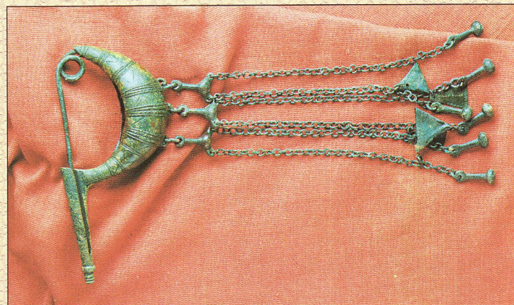
Mokronog (Ribjek) - bronasta čolničasta fibula z obeski

Prebivalci starejše železnodobne dolenske skupine so živeli v rodovno družinski skupnosti, s plemiškim slojem, ki je v svojih rokah združeval ekonomski, politični, vojaški in duhovni primat ter svoj izjemni status potrjeval tudi ob pogrebnih obredih in v pogledu na posmrtno življenje.