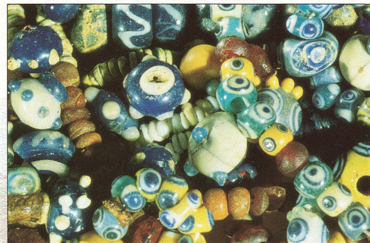
Novo mesto - steklene jagode ogrlic iz različnih grobov (6.-4. stoletje p.n.š.)

Konec 19. in v začetku 20. stoletja so gomile postale hvaležen plen kopačev in starinoslovcev, ki so hiteli polnit vitrine tedaj nastajajočih muzejev na Dunaju, v Gradcu in Ljubljani. Posavski muzej v Brežicah, Belokranjski muzej v Metliki in Dolenjski muzej v Novem mestu hranijo bogate zbirke halštatskega gradiva, ki sodi med najpomembnejšo nacionalno halštatskodobno dediščino in Dolenjsko umešča v evropski prazgodovinski vrh.