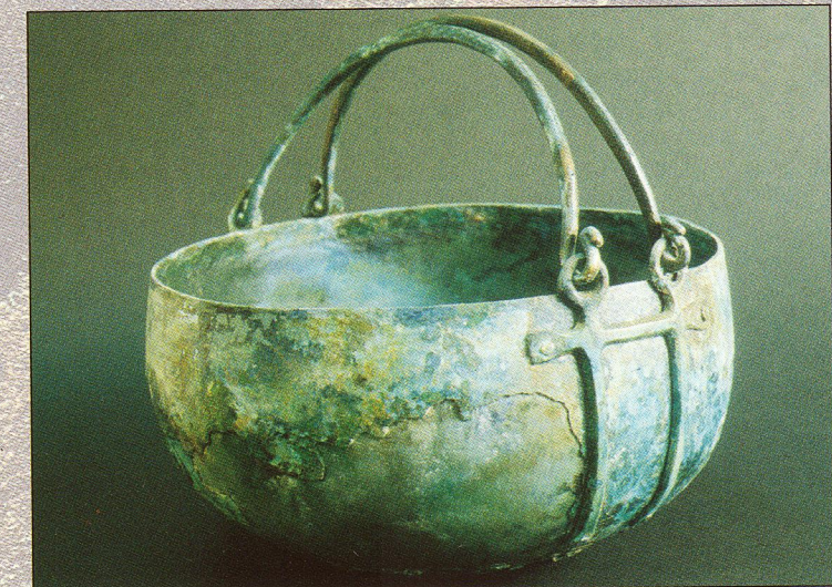
Medvedjek - bronast kotliček s križnimi atašami

Najprej se bomo pripeljali mimo Boštanja na ogled najdišč v okolici Mokronoga. Pot mimo Volčjih Njiv in Mirne na Trbine - ogled najdišč. Nadaljevanje poti čez Trebnje do Vrhtrebnjega z ogledom gradišča. V Dobrnici ogled gradišča Cvinger ter gomilnih grobišč - Dobrava in Reva. Preko Žužemberka do Dvora in Vinkovega Vrha z utrjenim gradiščem in gomilnim grobiščem, mimo Soteske bomo prišli do Dolenjskih Toplic, kjer si bomo ogledali arheološko pot Cvinger. Arheološko potepanje bomo končali v Novem mestu z ogledom najdišč Marof in Kapitelska njiva ter arheoloških zbirk v Dolenjskem muzeju.