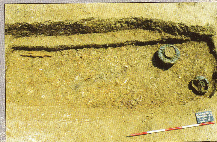
Novo mesto - Kapitelska njiva, grob iz starejše železne dobe s pridatki ob odkritju

Magdalenska gora - z urejeno arheološko potjo, Stična - utrjeno prazgodovinsko gradišče in halštatske gomile, mimo Medvedjeka z izkopano halštatsko gomilo, naprej do Trebnjega - utrjeno gradišče Kunkelj na Vrhtrebnjem, proti Mirni na Trbinc - naselje in prostor grobišča. Vožnja mimo Vesele Gore do Mokronoga - najdišča Ribjek, Slepšek, Križni Vrh, Ostrožnik, Žempoh. Pot po dolini Laknice do Vinjega Vrha - razgledno utrjeno gradišče in grobišča nad Belo Cerkvijo in Šmarjeto, in proti Cerovemu Logu in G. Vrhpolju do Mihovega z grobiščem in naseljem. Vožnja mimo prazgodovinskega gomilnega grobišča Brusnice. Zadnja postaja je v Novem mestu v Dolenjskem muzeju z ogledom arheoloških zbirk.