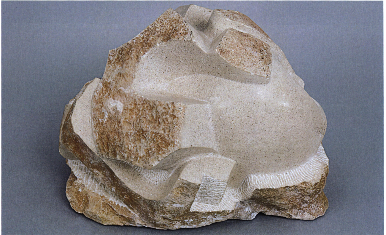
Rastvaranje, 2006 / Razkroj, 2006 / Zersetzung, 2006 / Disintegration, 2006