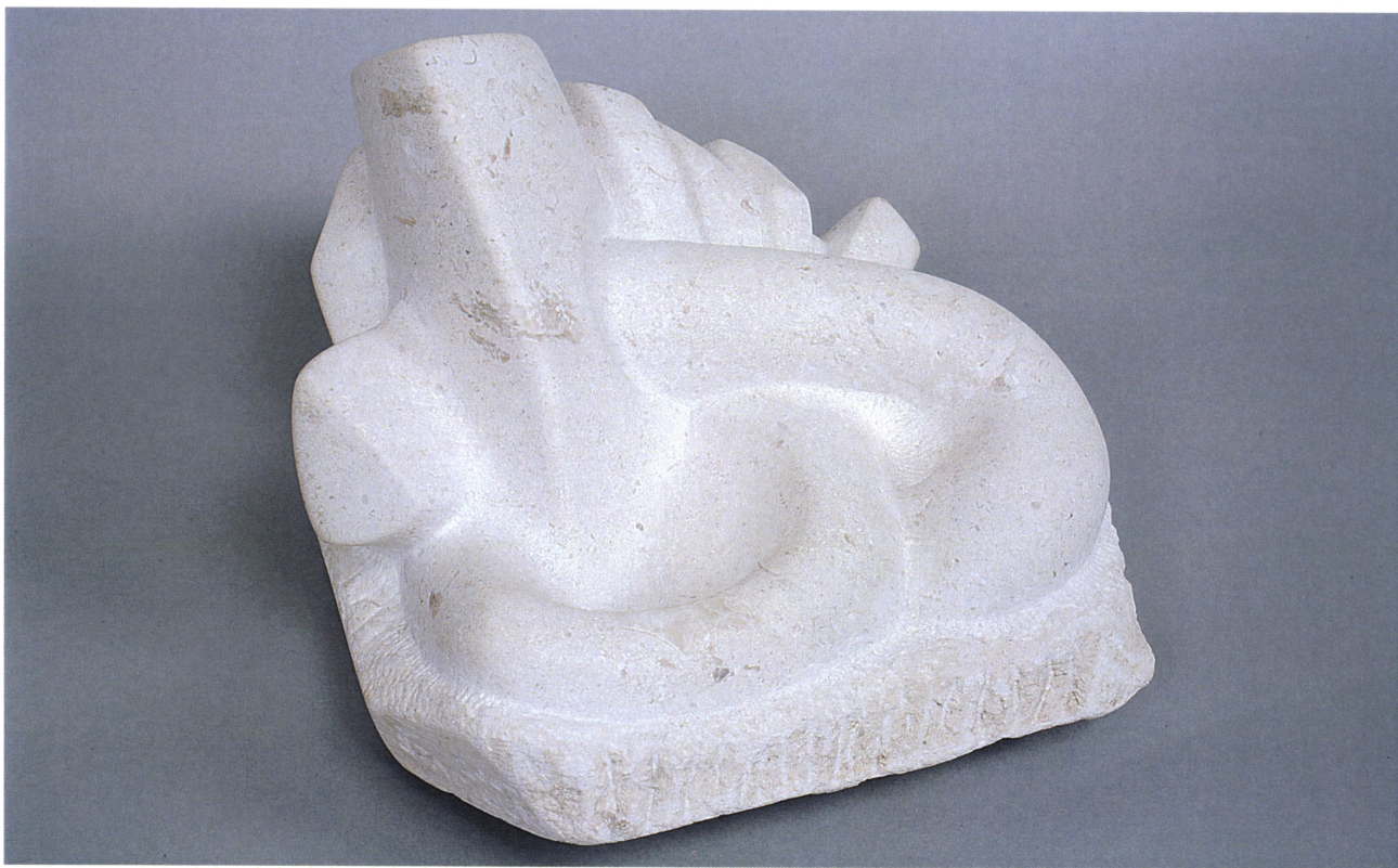
My way, 2007