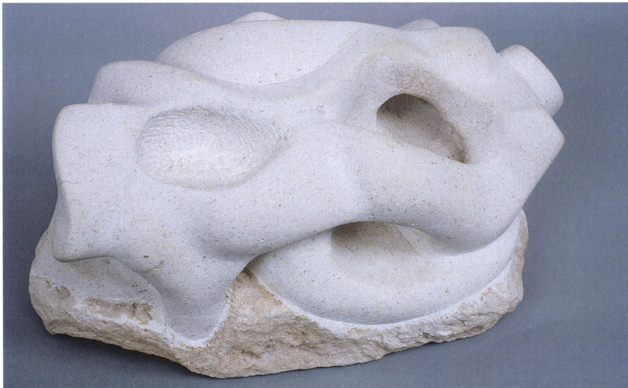
Bez naslova, 2007 / Brez naslova, 2007 / Ohne Titel, 2007 / No title, 2007