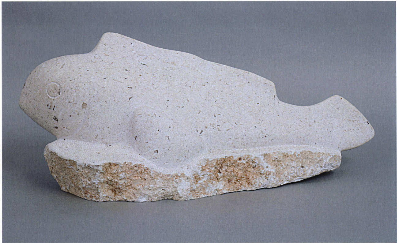
Suha riba, 2007 / Suha riba, 2007 / Der Fisch trocken, 2007 / Dry fish, 2007