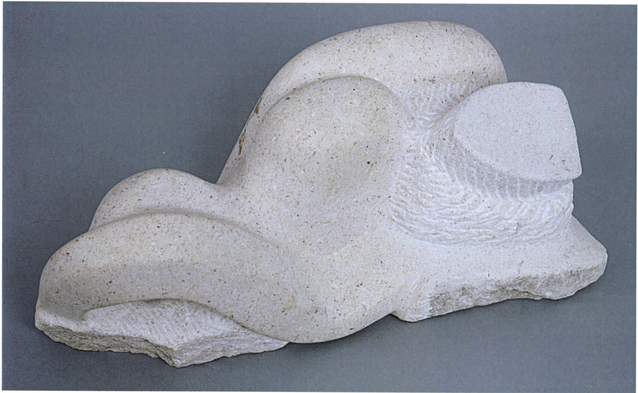
Tri vala, jedna barka, 2007 / Trije vali, ena barka, 2007 / Drei Wellen, ein Boot, 2007 / Three waves, one boat, 2007