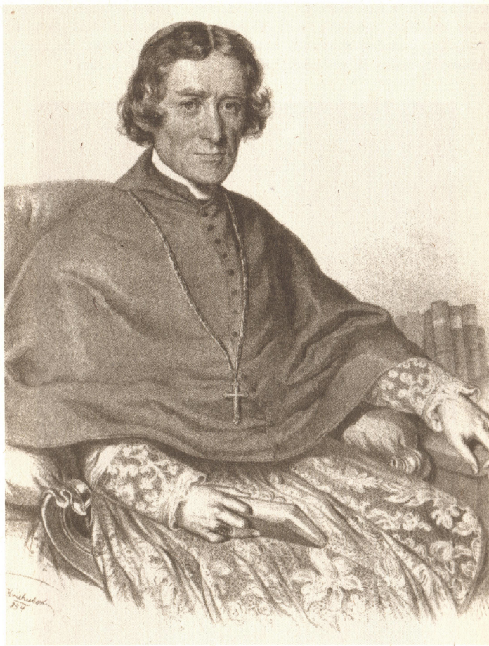
Josef Kriehuber: Friderik Baraga, 1854, litografija, 33 x 24,5 cm

Slikar Josef Kriehuber je upodobil škofa Friderika Barago v najlepši življenjski dobi, na višku njegove slave in moči. Drža je samozavestna, iz nje veje poglobljena duhovnost in askeza tega velikega Slovenca. S poudarki okrog oči in karakterističnimi potezami okrog ust je napovedal nadpovprečno odločnost tega moža. Kriehuber je naslikal škofa v tronu sedečega do kolen in s tem izkoristil možnost upodobitve čipkastega koretlja, kar daje Baragi še neko drugo dimenzijo čustvene duhovnosti, kakršna veje iz vseh njegovih pisem. Knjige na polici naj bi ilustrirale škofa Friderika Barago kot pisatelja.