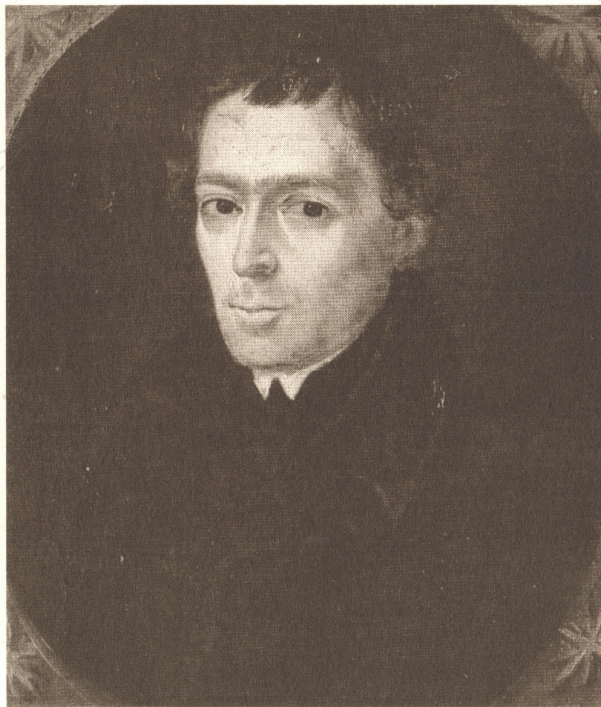
Avtoportret: Friderik Baraga kot kaplan

Na naslovni strani: Zaščitni znak iz raziskovalne naloge Baragova zapuščina kot turistični proizvod, 1994, ki ga je oblikoval Borut Dvornik. Sestavljen je iz treh delov: siluete Friderika Barage, peresa za pisanje in logotipa.