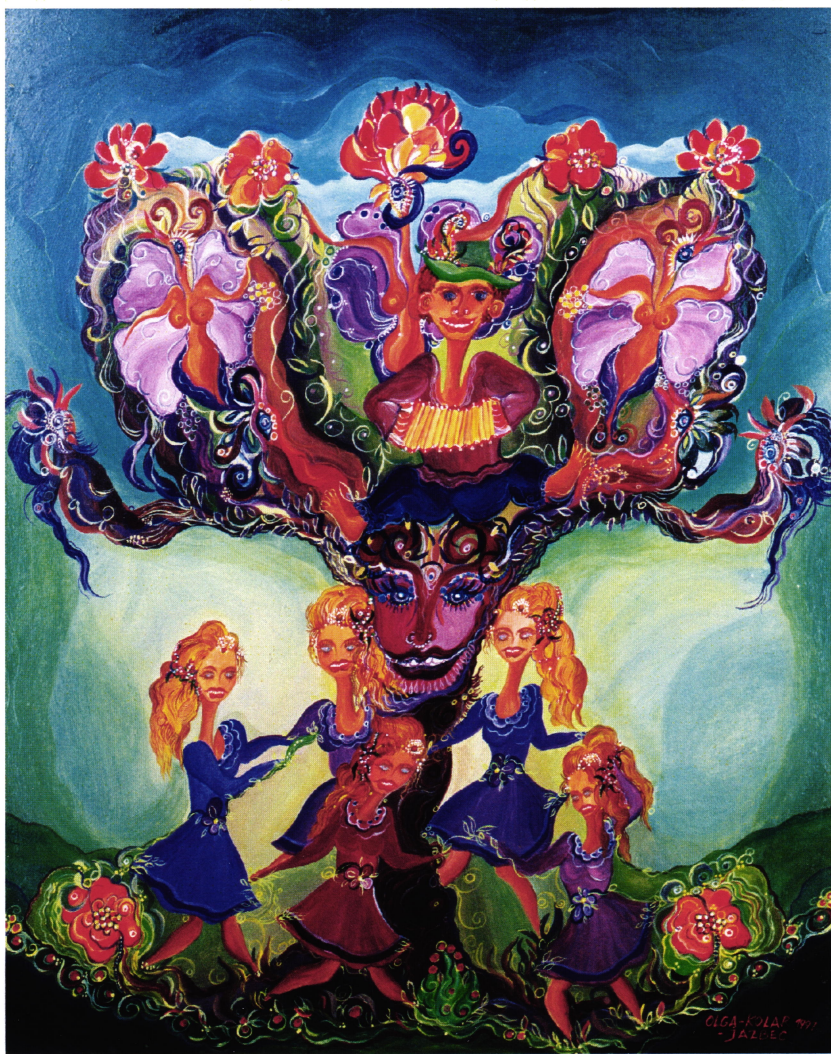
Praznovanje, 1997, olje na lesonitu, 50 x 40 cm