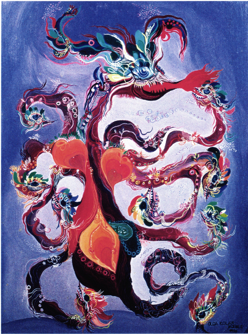
Ognjena boginja, 1988, olje na lesonitu, 41 x 31 cm