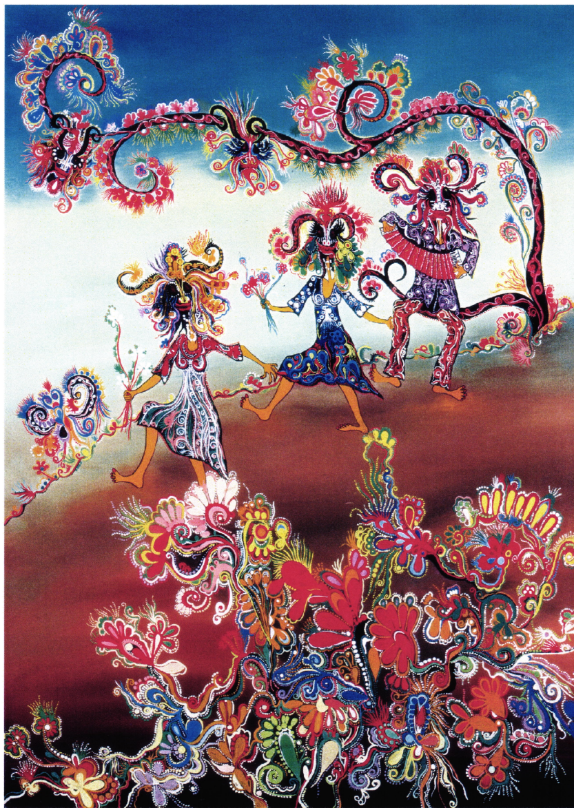
Vesela pomlad, 1977, olje na steklu, 67 x 48 cm