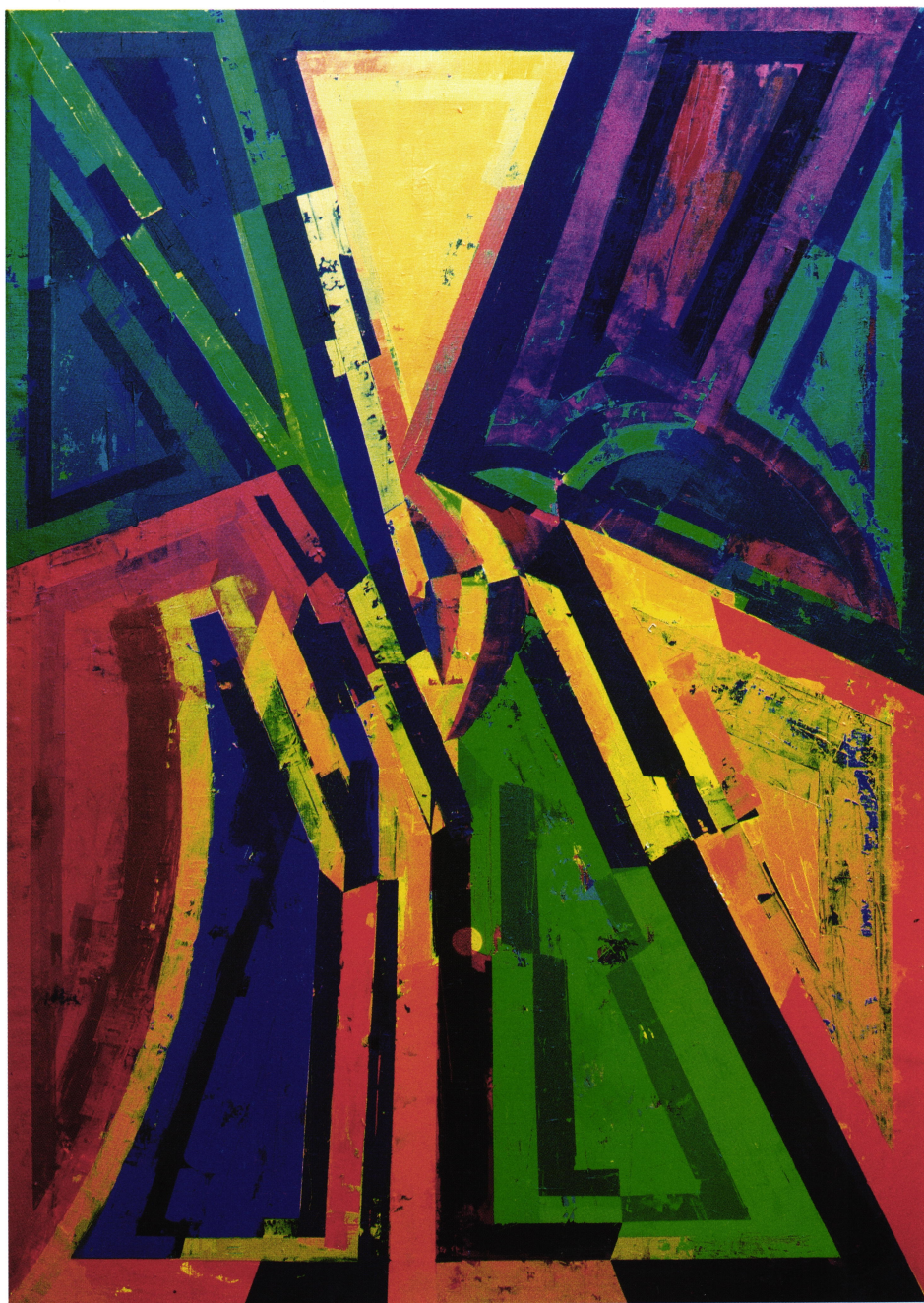
Preobrazba, 1999, 190 x 135 cm