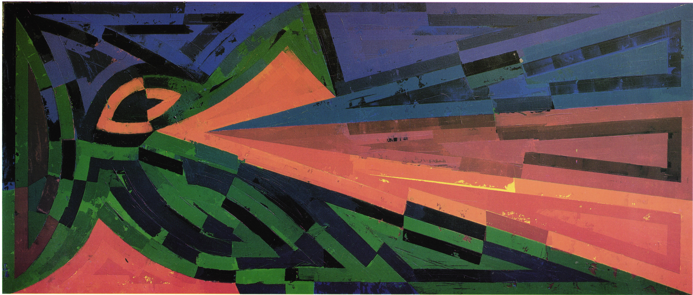
Mera časa, 1999, akril/platno, 90 x 200 cm