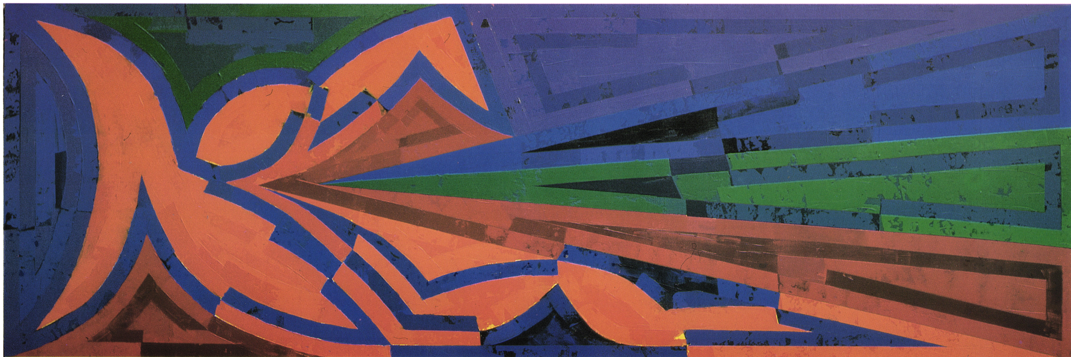
Mera časa, 1999, akril/platno, 70 x 200 cm