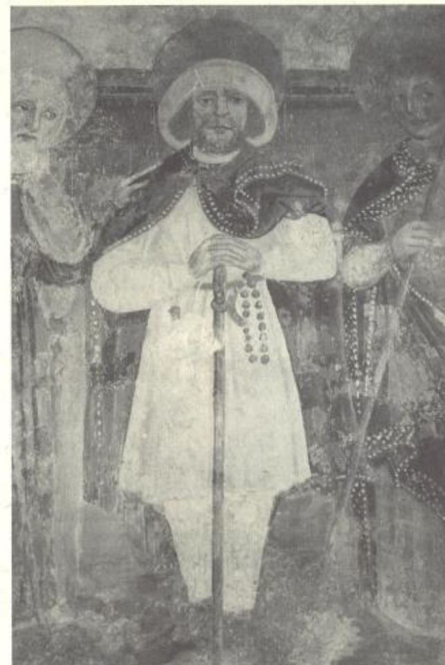
sv. Jakob s portretnimi potezami naročnika

Svetišče in slavalok sta poslikana s freskami, slavalok tudi na ladijski strani; te so v dediščini srednjeveške tradicije zelo pomembna ostalina, čeprav se iztekajo že v začetek renesanse. Datirane so med letoma 1500 in 1510. Najzanimivejša upodobitev je družba apostolov na severni strani svetišča, med katerimi je v sredini sv. Jakob s portretnimi potezami naročnika v maski romarja.