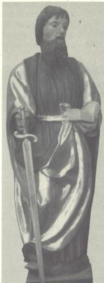
gotski kip sv. Pavla

sv. Rupert in sv. Pavel, ki sta sedaj v šentrupeški župnijski cerkvi, pa sta celo gotskega porekla, domnevno iz gotskih oltarjev šentrupeške cerkve; po izročilu je oltar prvotno stal v župnijski cerkvi in so ga šele kasneje prestavili na Veliki Cirknik.