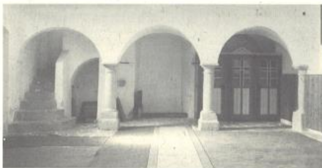
pogled proti pevskega koru

Današnja podoba cerkve kaže na enoten obnovitveni koncept - čeprav nekateri znaki opozarjajo na njeno srednjeveško osnovo - ki je bil izveden sredi 17. stoletja, kakor cerkve na Zaloki, Gorenjih Jesenicah in pri