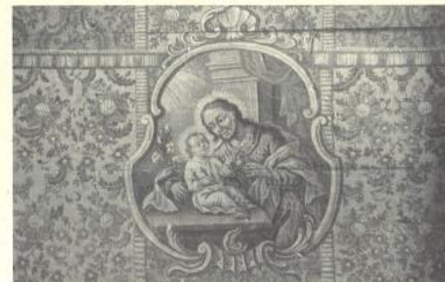
Anton Postl: Sv. Jožef, antependij glavnega oltarja

V svetišču je bil leta 1855 postavljen nov oltar na starejšo kamnito menzo, ki ima spodnji rob posnet. Spredaj jo zapira antependij z