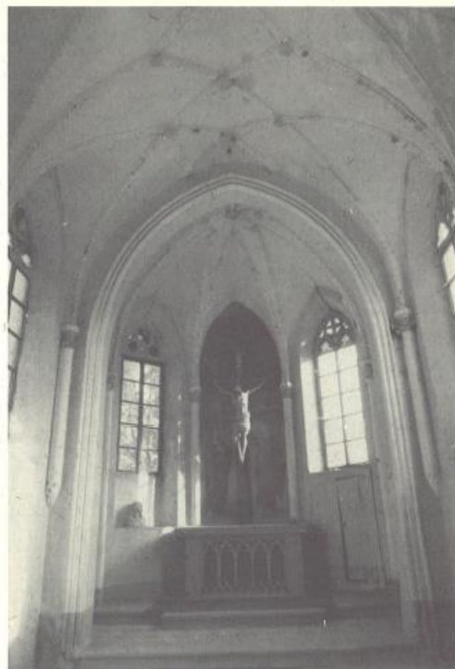
pogled iz zahodne strani na kapelo

ambicij, ki so se širile po Evropi sredi 19. stoletja; oplaja se ob zgodovinskem spominu in izživlja v dekoraciji in na stavbni konstrukciji. Celota daje vtis igrivosti trdnih in navideznih stavbnih elementov, ki se spreminjajo v slikovit privid kakšnega izdelka iz marcipana, na videz zelo dragocene, vendar začasne odrske kulise. Kot tako z izrazitimi znaki tovrstnega občutka jo lahko uvrstimo med najlepše primerke novogotske arhitekture nasploh. Prvotni križ visi zdaj obnovljen na dvorišču šentrupeškega župnišča.