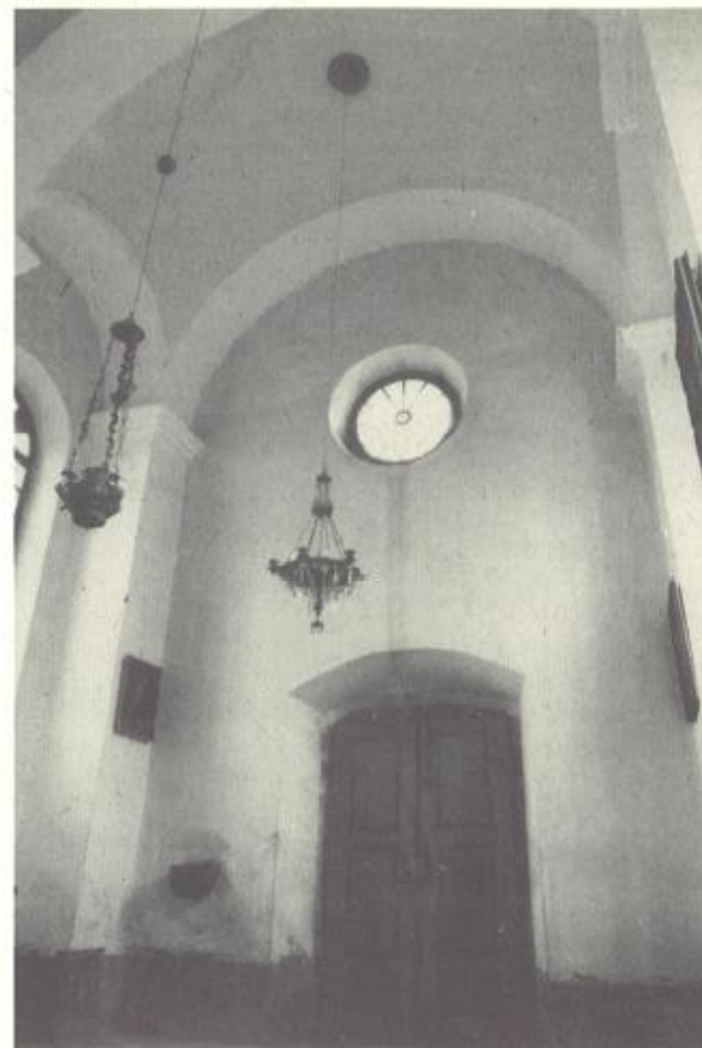
pogled v obočno kompozicijo

Kapela Žalostne Matere Božje izpričuje nenavadno eleganco novega, sicer lahko zelo pustega novorenesančnega sloga. Notranjost je prostorna in svetla. Ugoden občutek prostora izhaja iz sorazmerij dolžine, širine in višine ter z južne strani prihajajoče obilice svetlobe skozi visoka in široka okna.