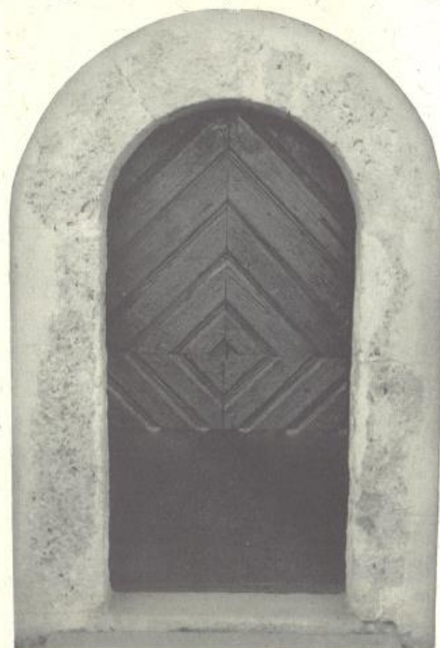
romanski portal v južni steni ladje

Nad zaselkom Hrastno stoji nekoliko zamaknjeno podružnična cerkev sv. Duha na Vihru. Njena zgodovina je zelo zapletena. Je razmeroma zgodaj izpričana in je ena najstarejših podružnic v šentrupeški župniji. V listinah je izpričana 1275. leta, polkrožni romanski portal pa priča o njenem starejšem izvoru. Svetišču je bila ladja prizidana še pred letom 1644, ko so v njej postavili dva lepa renesančna oltarja. Leta 1823 sta bila prizidana zvonik in zakristija, v ladji pa so 1836. leta prvotni lesen strop nadomestili z oboki.