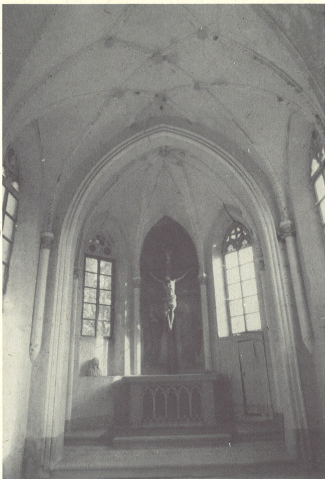
pogled iz zahodne strani na kapelo

ambicij, ki so se širile po Evropi sredi 19. stoletja; oplaja se ob zgodovinskem spominu in izživlja v dekoraciji in na stavbni konstrukciji. Celota daje vtis igrivosti trdnih in navideznih stavbnih elementov, ki se spreminjajo v slikovit privid kakšnega izdelka iz marcipana, na videz zelo dragocene, vendar začasne odrske kulise. Kot tako z izrazitimi znaki tovrstnega občutka jo lahko uvrstimo med najlepše primerke novogotske arhitekture nasploh. Prvotni križ visi zdaj obnovljen na dvorišču šentrupeškega župnišča.