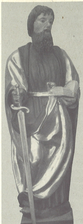
gotski kip sv. Pavla

sv. Rupert in sv. Pavel, ki sta sedaj v šentrupeški župnijski cerki, pa sta celo gotskega porekla, domnevno iz gotskih oltarjev šentrupeške cerkve; po izročilu je oltar prvotno stal v župnijski cerkvi in so ga šele kasneje prestavili na Veliki Cirknik.