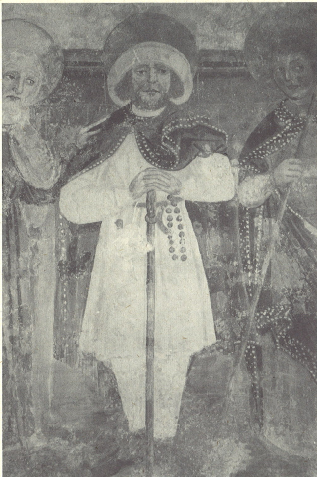
sv. Jakob s portretnimi potezami naročnika

Svetišče in slavolok sta poslikana s freskami, slavolok tudi na ladijski strani; te so v dediščini srednjeveške tradicije zelo pomembna ostalina, čeprav se iztekajo že v začetek renesanse. Datirane so med letoma 1500 in 1510. Najzanimivejša upodobitev je družba apostolov na severni strani svetišča, med katerimi je v sredini sv. Jakob s portretnimi potezami naročnika v maski romarja.