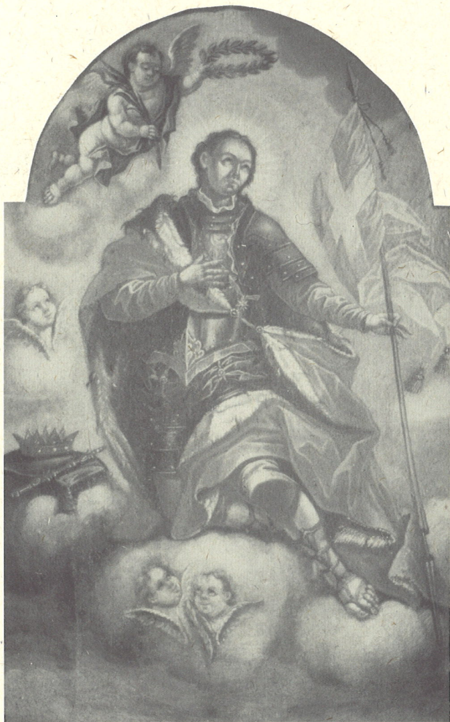
Anton Postl: Sv. Kancijan

Današnja podoba p.c. sv. Kancijana v Gorenjih Jesenicah je plod mnogih časovnih obdobj in prezidav. Čeprav se prvič določno omenja