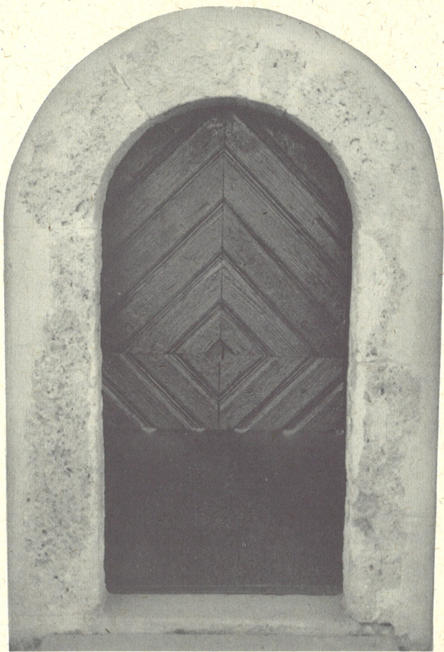
romanski portal v južni steni ladje

N ad zaselkom Hrastno stoji nekoliko zamaknjeno podružnična cerkev sv. Duha na Vihru. Njena zgodovina je zelo zapletena. Je razmeroma zgodaj izpričana in je ena najstarejših podružnic v šentruperški župniji. V listinah je izpričana 1275. leta, polkrožni romanski portal pa priča o njenem starejšem izvoru. Svetišču je bila ladja prizidana še pred letom 1644, ko so v njej postavili dva lepa renesančna oltarja. Leta 1823 sta bila prizidana zvonik in zakristija, v ladji pa so 1836. leta prvotni lesen strop nadomestili z oboki.