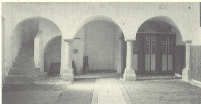
pogled proti pevskemu koru

Današnja podoba cerkve kaže na enoten obnovitveni koncept - čeprav nekateri znaki opozarjajo na njeno srednjeveško osnovo - ki je bil izveden sredi 17. stoletja, kakor cerkve na Zaloki, Gorenjih Jesenicah in pri