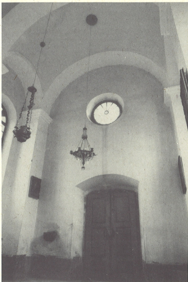
pogled v obočno kompozicijo

Kapela Žalostne Matere Božje izpričuje nenavadno eleganco novega, sicer lahko zelo pustega novorenesančnega sloga. Notranjost je prostorna in svetla. Ugoden občutek prostora izhaja iz sorazmerij dolžine, širine in višine ter z južne strani prihajajoče obilice svetlobe skozi visoka in široka okna.