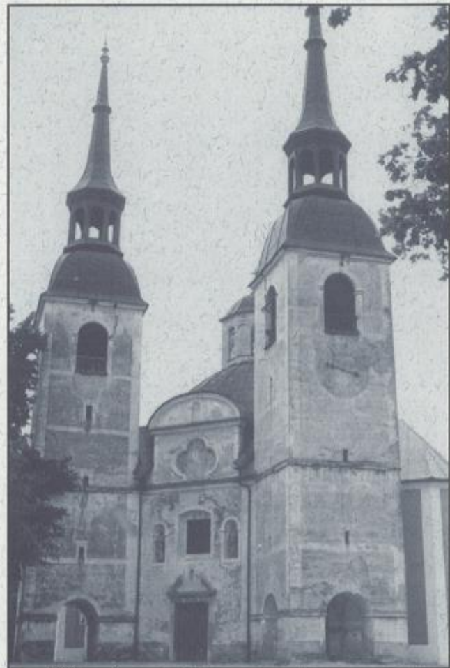
zunanjščina z jugovzhoda