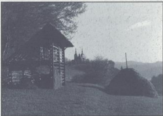
pogled na cerkev s severozahoda

V času, ko je nastala romarska cerkev sv. Frančiška Ksaverija na Veseli Gori, je pobožnost do sv. Frančiška dosegla svoj višek. Svetnik je razburkal takratni katoliški svet kot najintimnejši prijatelj ustanovitelja Družbe Jezusove Ignacija Lojolskega, ki ga je spodbudil, da se je odpravil na misijonsko pot po Daljnem vzhodu, kjer je dosegel nenavadne spreobrnitve in uspehe. Vzporedno z uspehom Družbe Jezusove sta rasli tudi čast in moč njenega ustanovitelja Ignacija in njegovih prijateljev, med katerimi je bil Frančišek na prvem mestu. Skupaj z Ignacijem sta bila leta 1622 razglašena za svetnika. Odslej so se pobožnosti do teh dveh svetnikov naglo širile po Evropi. Nekaj let pred Veselo Goro je na Slovenskem zaslovela božja pot k sv. Frančišku Ksaveriju na Straži pri Gornjem Gradu.