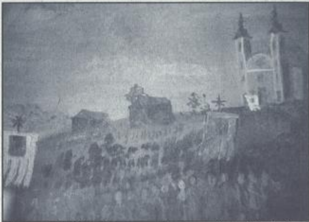
detajl freske z romarsko procesijo na Veselo Goro

V času, ko je nastala romarska cerkev sv. Frančiška Ksaverija na Veseli Gori, je pobožnost do sv. Frančiška dosegla svoj višek. Svetnik je razburkal takratni katoliški svet kot najintimnejši prijatelj ustanovitelja Družbe Jezusove Ignacija Lojolskega, ki ga je spodbudil, da se je odpravil na misijonsko pot po Daljnem vzhodu, kjer je dosegel nenavadne spreobrnitve in uspehe. Vzporedno z uspehom Družbe Jezusove sta rasli tudi čast in moč njenega ustanovitelja Ignacija in njegovih prijateljev, med katerimi je bil Frančišek na prvem mestu. Skupaj z Ignacijem sta bila leta 1622 razglašena za svetnika. Odslej so se pobožnosti do teh dveh svetnikov naglo širile po Evropi. Nekaj let pred Veselo Goro je na Slovenskem zaslovela božja pot k sv. Frančišku Ksaveriju na Straži pri Gornjem Gradu.