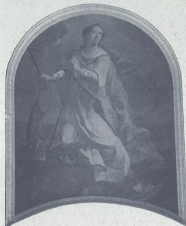
Valentin Metzinger: Sv. Marjeta