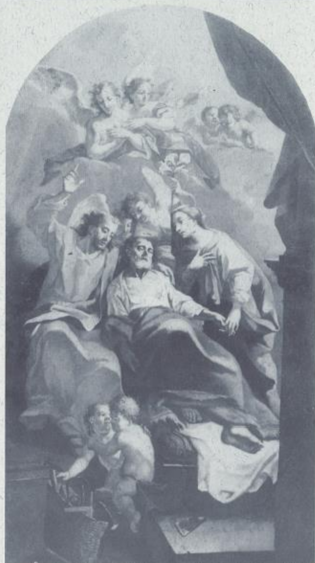
Valentin Metzinger: Smrt sv. Jožefa

V kapeli sv. Janeza Nepo muka visi v osrednji niši oljna slika Smrt sv. Janeza Nepomuka, zrelo delo enega najboljših slovenskih baročnih slikarjev Fortunata Berganta (1721 - 1769), z vsemi slogovnimi