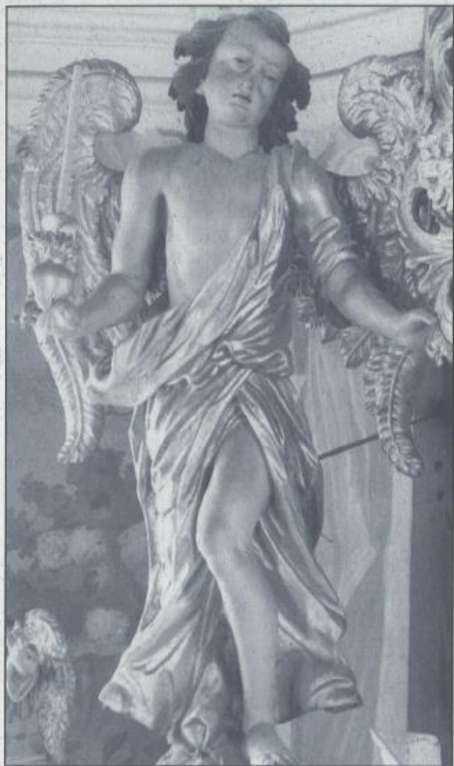
angel z glavnega oltarja