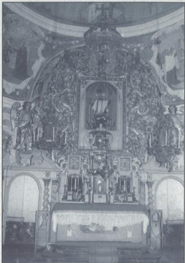
pogled proti glavnemu oltarju