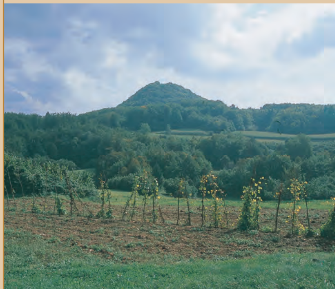
Pogled od Sel pri Šumberku proti Kozjaku

uporabljajo kot vozne poti, vendar le za kmečke vozove. Vsako popraviljanje, zaključuje spremljajoče besedilo avstrijske vojaške karte, bi bilo tu zaman.