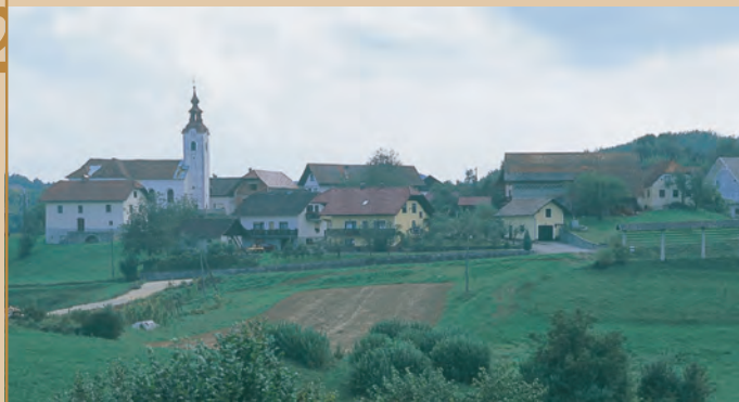
Pogled na Sela pri Šumberku

Sela pri Šumberku, gručasta vas v severovzhodnem delu Suhe krajine, ležijo precej visoko med gozdnatimi griči sredi vrtačastega sveta, stisnjena v podnožju treh vrhov: Šumberka, Vrha in Velikega hriba. Na najnižjem, 540 m visokem kopastem Šumberku so zleknjene razvaline enega najstarejših "pravih" gradov na Kranjskem. Zaznamovala sta ga mogočen bergfrid (glavni obrambni stolp) in palacij (stanovanjski del gradu) z obzidjem. Dva in pol kilometra vzhodno od tu pa bomo nad vasjo Selce našli ostanke do tal porušenega gradu Kozjak, katerega nastanek je povezan z delitvijo posesti bližnjega gradu Šumberk.