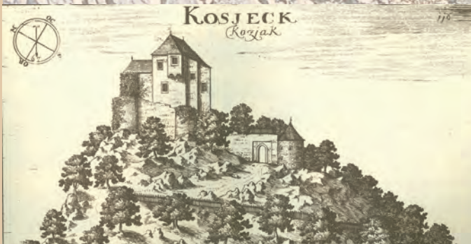
Grad Kozjak na bakrorezu v Valvasorjevi Topografiji