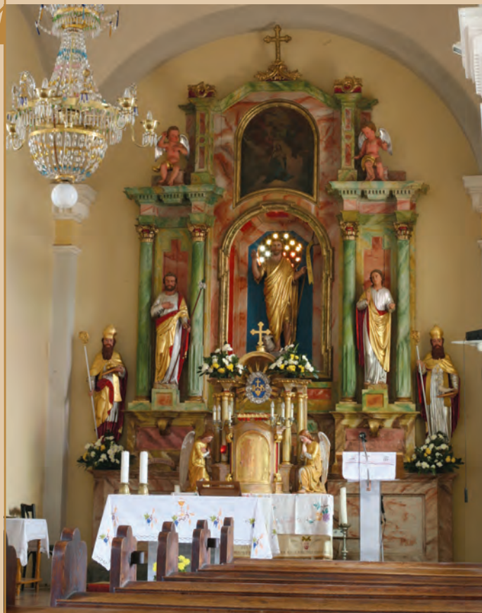
Pogled na glavni oltar v cerkvi sv. Janeza Krstnika na Selih pri Šumberku, delo Ivana Šubica iz 1885. leta

kraja v tem delu Suhe krajine, ampak petkrat manjše gručasto naselje Arčelco, ki leži podobno kot Sela sredi vrtačastega in z gozdom poraslega sveta. Med trdnimi zgradbami omenja cerkev v Arčelci, nekaj kmečkih hiš in stara gradova Šumberk in Kozjak. Bližnji vrhovi so Brezov vrh, Kremenjek in oba grajska hriba. Gozd je tu srednje visok, skoraj sama goščava in grmovje. Poti so ozke in kamnite, šteti jih je moč le med pešpoti. Sicer se