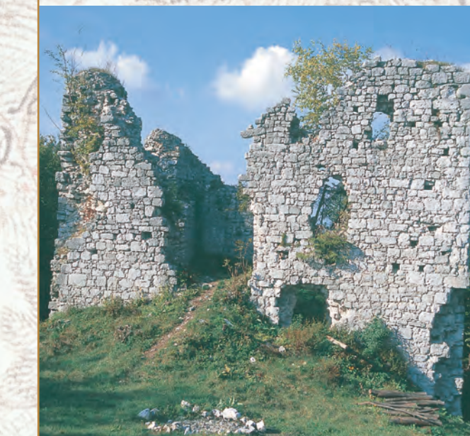
Razvaline gradu Šumberk

Sredi 15. stoletja je bil grad Šumberk že v razvalinah, nato pa obnovljen in v 17. stoletju dokončno opuščen. Dobro razvidna stolpasta stavba se kaže kot osrednji in najstarejši objekt kompleksa. Očitno je, da gre za primer visoke trdne hiše iz druge polovice 11. stoletja. Pozidana je na razmeroma velikem kvadratnem tlorisu na umetno izravnane gorskem hrbtu. Danes sta ohranjeni le še spodnji etaži, na Valvasorjevi upodobitvi pa je hiša poleg pritličja obsegala še tri nadstropja. Zidovi so na zunanji strani izdelani iz grobo obdelanih klesancev, opazna pa je težnja po plastenju. Klesanci na vogalih so nekoliko večji. Notranja stran je zidana manj pravilno iz deloma obklesanih lomljenecv. Vhod v hišo je bil urejen na južni strani v prvem nadstropju, vendar je sedaj že skoraj že skoraj v celoti sesut. Pritličje so osvetljevale ozke pravokotne line z navzven lijakasto zožujočimi se ostenji.