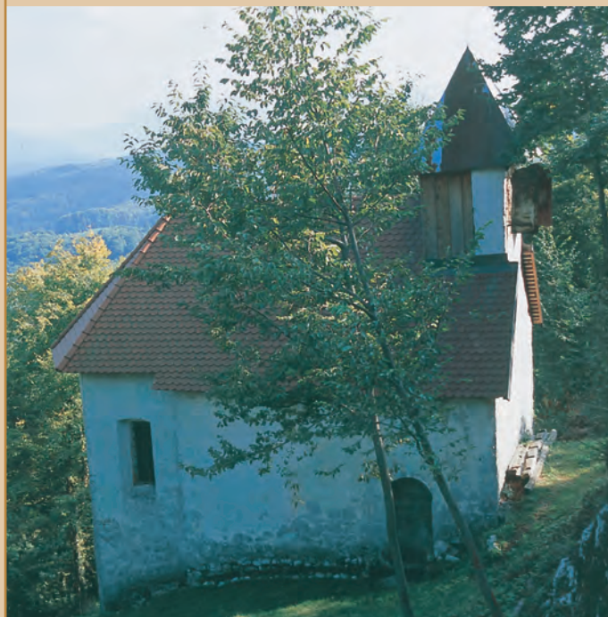
Danes podružnična cerkev sv. Katarine, nekoč grajska kapela gospodov Šumberških

Poročila o uničenju in propadanju gradov najdemo že v srednjem veku, vendar pa jih razumemo predvsem kot požige lesenih delov, ki so jih nato spet obnovili. Včasih so tudi izruvali vhodni portal in grad tako simbolično onesposobili. Le izjemoma so rušili tudi trdno zidane zidove. Da ob nasilnih rušenjih srednjeveških gradov dejansko ni prišlo do rušenja zidanih delov, kaže prav grad Šumberk, kjer so ob obnovi sredi 15. stoletja