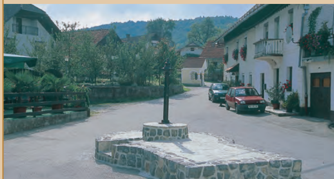
Trško jedro Sel pri Šumberku

in se v mladem bukovju oglašajo kukavice. Lepo in prijetno pa je tukaj tudi jeseni, ko začne zoreti sadje in se rdečiti vrtno in gozdno drevje pa vinska trta, in vsa pokrajina žari kakor začarana v brezštevilih barvah. Na razglednem Šumberku bo obiskovalec ob jasnem vremenu nagrajen tudi s pogledom na Karavanke, Julijske Alpe s Triglavom in ljubljanski grad.