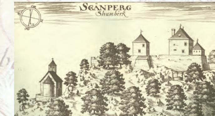
Grad Šumberk v Valvasorjevi Topografiji sodobne Vojvodine Kranjske, 1679

Že v prvem nadstropju pa so bila večja, sedaj porušena okna; ohranjena so edino izredno široka ostenja s sledovi obokenskih klopi. Sledov prečnih zidov v stavbi ni. Če so obstajali, so bili nedvomno leseni. Etaže so bile predeljene z lesenimi tramovnimi stropovi, ki so počivali na policah, ki so nastale ob stopničastem zoževanju zidov s posameznimi etažami. O obliki prvotne strešne konstrukcije ni podatkov. Na Valvasorjevi upodobitvi je stavba krita s strmo štirikapno šotorasto streho, sledov kakšne obrambne podstrešne poletaže ali lesenih obrambnih hodnikov pa ni opaziti.