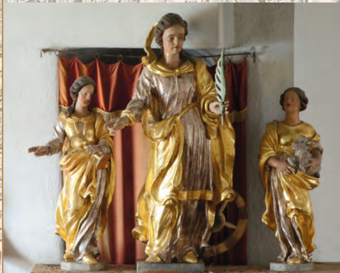
Sv. Barbara, sv. Katarina in sv. Neža, 17. stoletje, lesene kipe so v župnijsko cerkev prenesli iz podružnice na Šumberku

Stični – cistercijski samostan Stična • grad Šumberk / na grebenu visokega hriba nad Seli, tik nad romansko podružnico sv. Katarine, ob lokalni cesti iz Žužemberka proti Zagorici • grad Kozjak / razvalina vrh skalne kope nad vasjo Dolenje Selce pri Dobrniču