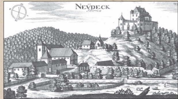
Barkorez iz Valvazorjeve Topografije sodobne Vojvodine Kranjske

Za pešačenje je dostop prijaznejši po pobočju z vzhodne strani. Prečkamo troprekatni most in na levi strani ob pobočju grajskega hriba zagledamo zleknjen bazar, preurejen iz nekdanjih dvoprekatnih grajskih ribnikov. Po lahki vzpetini pridemo še do edinega ostanka nekdanjega utrdbenega sistema s polkrožnim stolpom,