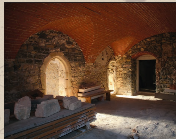
Ohranjena portala v pritličju vzhodnega dela palacija