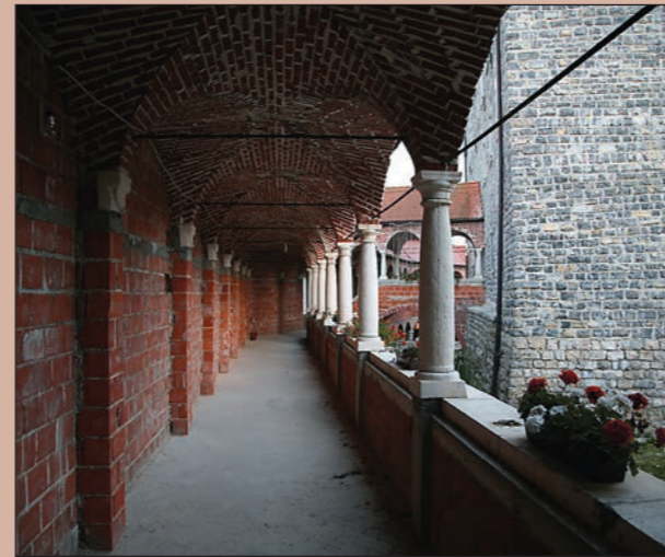
Prehod z arkadnega hodnika v palacij

Dostop do notranjosti je možen skozi portal z vzhodne strani, koder se pride na vzhodno grajsko dvorišče ali pa skozi zahodni portal, ki nas privede na zahodno grajsko dvorišče. Oba pristopa sta po svoji pomembnosti enakovredna, le da je pogled z zahodne strani učinkovitejši, ker je voden v daljši perspektivi, ki jo nakazujejo arkadni hodniki.