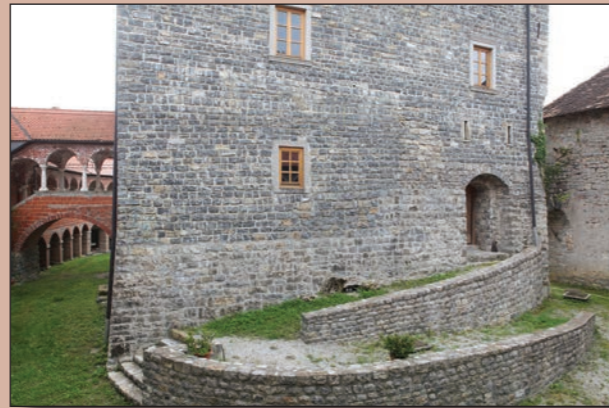
Vhod v najstarejši del palacija

Južna stena grajskega obzidja je bila prav tako brez stavbnih členov, ki bi nakazovali na notranji strani nanjo naslonjene renesančne arkade. Na zahodni strani je bila srednjeveškemu južnemu obzidju prizidana kašča za shranjevanje poljščin in je v celoti ohranjena do nekdanje višine še danes. V njenih dimenzijah je skrit nomos renesančne stavbne discipline in deluje kljub temu, da je bila namenjena za shrambo, kot lepotni ideal svojega časa. Z jugovzhodnim okroglim stolpom je bila povezana z obzidjem v enaki višini kot drugje, le da je bil zaradi nizko zastavljenih temeljev njen vtis še močnejši, še posebej zato, ker ni imela nobenih dekoracij razen zelo majhnih strelnih lin. Danes je obzidje obnovljeno. Zaradi višine in strmega terena pa je pristop z južne strani otežkočen.