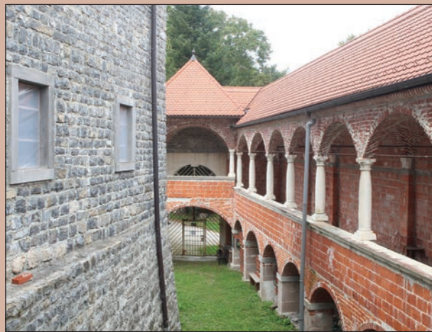
Pogled proti zahodnemu portalu

je visok 10 metrov in nima v spodnjem delu nobenih motečih odprtih razen okna v prvem nadstropju sredi dolžine, ki z notranje strani razsvetljuje prehod v palacij. Po obliki je renesančni dvojček onih dveh iz oglatega stolpa.