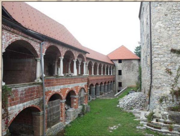
Južna stena z arkadnim hodnikom vodi do kašče