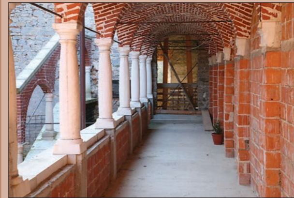
Najlepši del arkadnih hodnikov

Pritličje hrani največ dokazil za zgodovinski razvoj gradu. Nahajamo se v prostorih, ki so dvignjeni na nekaterih točkah do tri metre nad nivojem dvorišč. Zunaj vidno platenje žive skale v notranjosti potrjuje, da pod tlakom teh prostorov ni poglobljenih etaž in da je vsa tlorisna površina palacija razvrščena na nekdanji plošči izravnane hriba, ki je v predzgodovinskem obdobju služila za utrjeno gradišče. Ostanke hriba, ki so ščitili hrbet obrambnega sistema, so bili v kasnejših prezidavah vzdani v vmesne stene in so danes vidni v prvem prostoru jugozahodnega dela palacija in na notranji strani južne predelne stene predverja, ki deli tloris palacija na polovico.