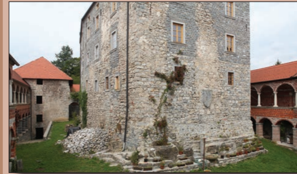
Vzhodna stena palacija z obeležjem Eme Krške