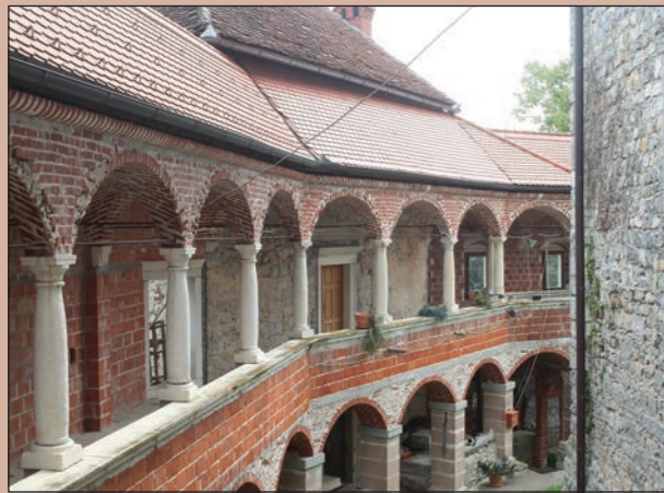
Del arkadnega hodnika na severnem in vzhodnem delu obzidja